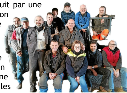
Une partie de l'équipe des bénévoles.

Pour sa 7 ème participation, le char composé d'une distillerie cachant un bar clandestin tracté par une parfaite reproduction d'une Cadillac noire d'époque, plongeait les spectateurs dans une ambiance « année folles et prohibition ».