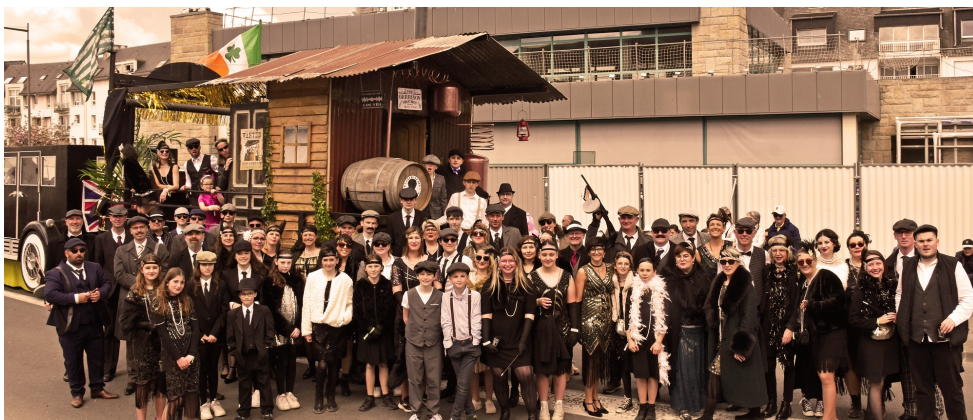
L'ensemble des participants devant le char « GANG S'THO » au Carnaval de Landerneau.

● « Gang S'THO », le char imaginé et construit par une vingtaine de bénévoles du comité d'animation Saintthonanim' a participé au « Carnaval de la Lune étoilée » de Landerneau qui a eu lieu dimanche 21 avril.